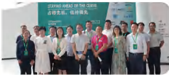
6月，安徽马鞍山，史记猪冻精全国发布会成功召开