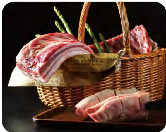
八方来喜·生鲜年猪礼