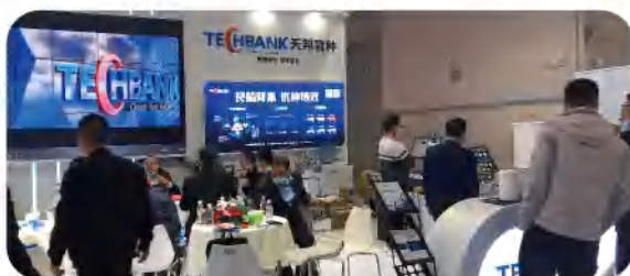
10月，相约重庆，史记育种品牌闪耀第10届李曼养猪大会