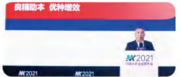
11月，中国大农业经营年会史记育种向行业分享《未来生猪产业核心竞争力分析》