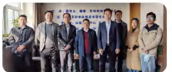
12月，天邦引入农银投资作为生猪育种产业的战略投资者，总规模4亿元

史记育种，2021，所有的付出因为快速增长而无限踏实！所有的努力因为收获荣誉而无限精彩！2022，为中国猪育种谱写高质量发展新篇章的征程上，史记勇毅前行。