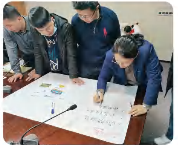
现场分组讨论分享