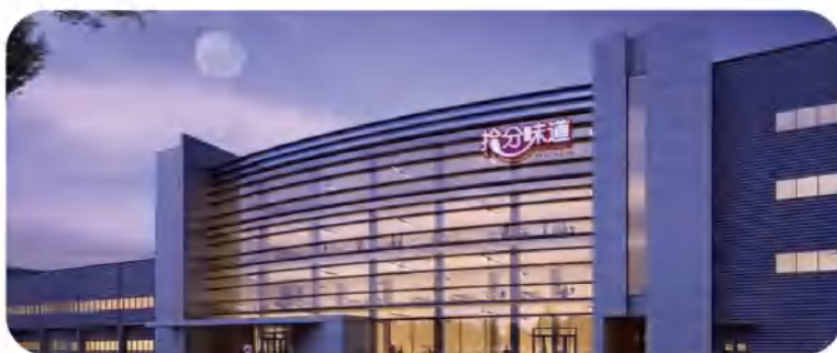
天邦拾分味道临泉工厂建成效果图

拾分味道秉承对美味食品的极致追求，得益于天邦在饲料、种源、养殖等领域的技术积累和一体化产业链优势，其猪肉不仅安全可靠，还具、香、嫩、糯、纯的独特品质，“清水一煮就飘香”！