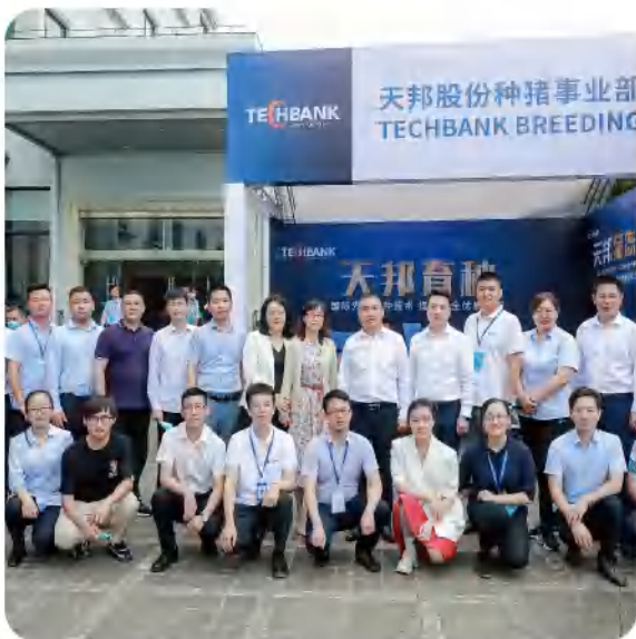
5月，“种”心为你，第三届中国规模猪场智造论坛看史记AI育种新技术

史记种猪源于国际著名种猪育种公司CG。2013年天邦收购Agreed Industry，2014年战略投资全球第二种猪育种公司-法国CG。史记以全球视野整合资源，拥有全球最丰富的种猪基因资源，实现全球同步育种，是全球化的育种公司。